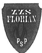
Przewodniczący Krzysztof Oleksak