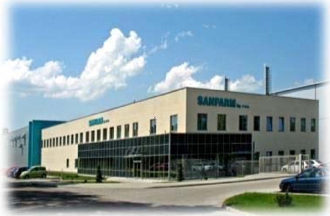
Sanfarm Sp. z o.o. – Nowa Dęba