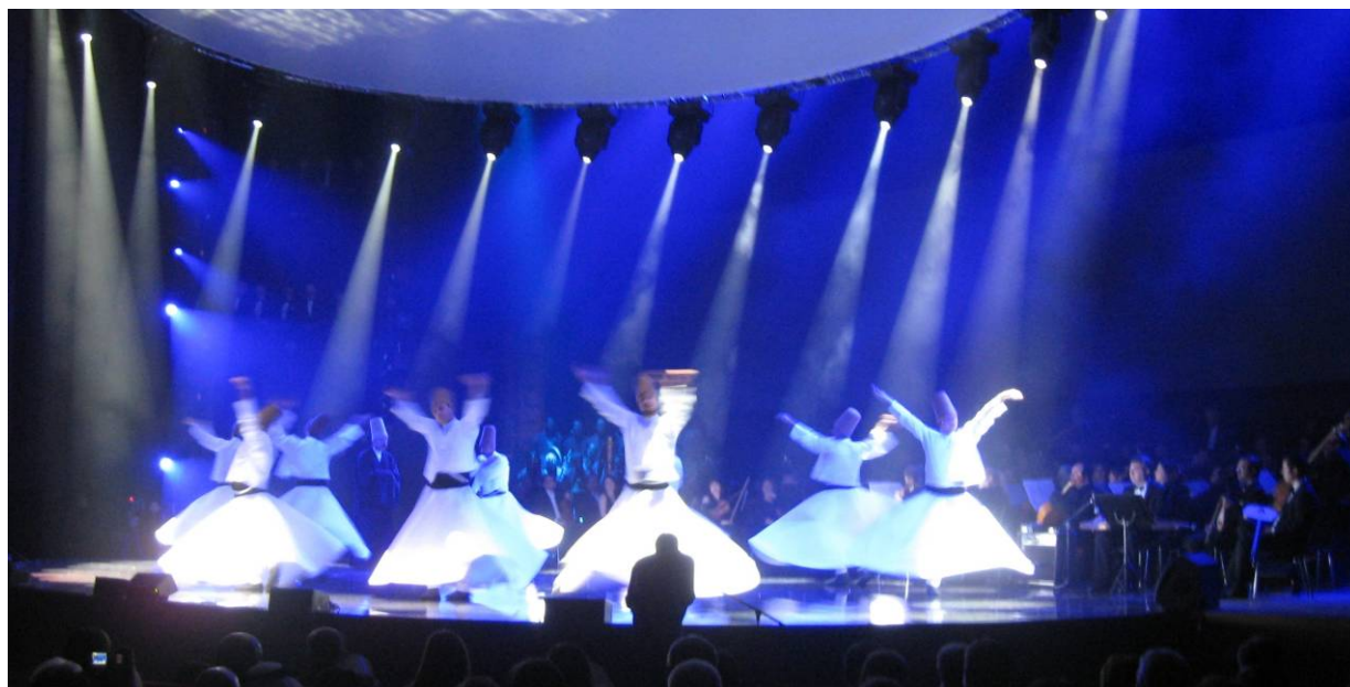
Migawka z programu artystycznego otwarcia projektu Stambuł 2010 - ESK : wirujący derwisze