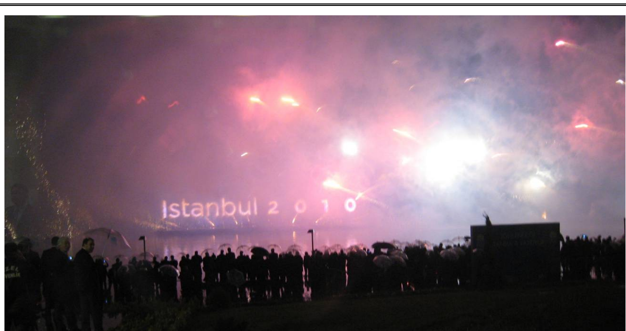
Zakończenie uroczystości: pokaz sztucznych ogni nad Złotym Rogiem

cach Stambułu: Taksim, Kadıköy, Sultanahmet, Pendik, Bağcılar oraz Beylikdüzü. Pokaz sztucznych ogni transmitowany był też w tureckiej telewizji, tak że oglądać go mogli wszyscy mieszkańcy kraju.