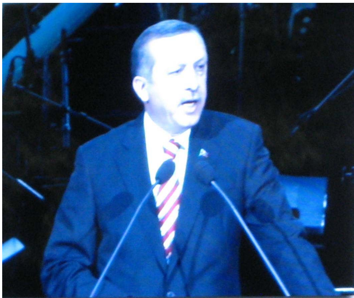
Wystąpienie Premiera rządu RT Tayyipa Recepta Erdogana

Wśród wystąpień, najważniejsze wygłosił Premier Recep Tayyip Erdogan .