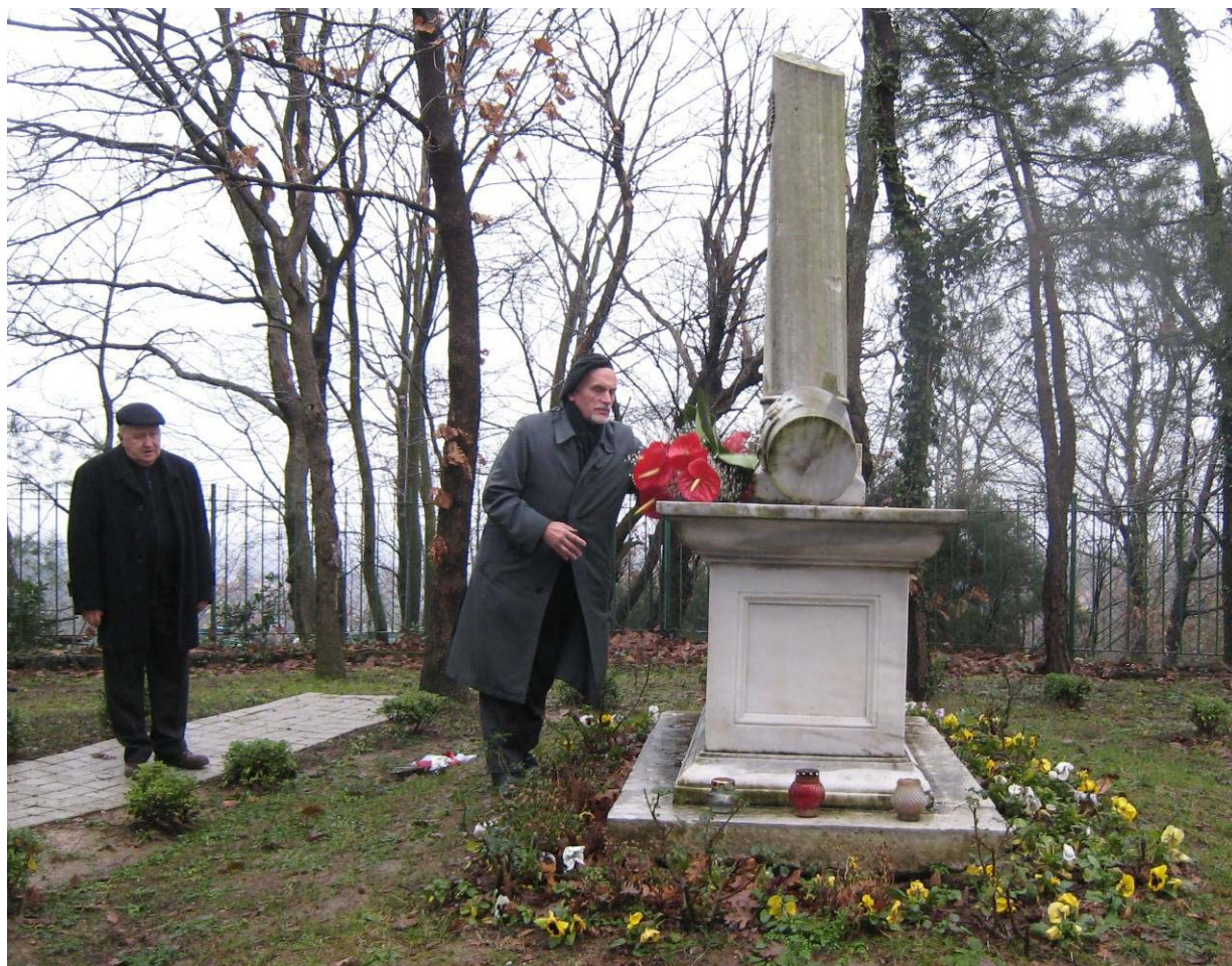
Senator P. Ł. Andrzejewski składa kwiaty na grobie Ludwiki Śniadeckiej na cmentarzu w Polonezköy/Adampolu (z tyłu stoi Antoni Dohoda )

W parafii przy kościele św. Antoniego polscy studenci studiujący w Stambule w ramach programu Erasmus uczą dzieci Polonii stambulskiej/tureckiej języka polskiego. Nauka finansowana jest przez rodziny uczęszczających na lekcje dzieci 19 .