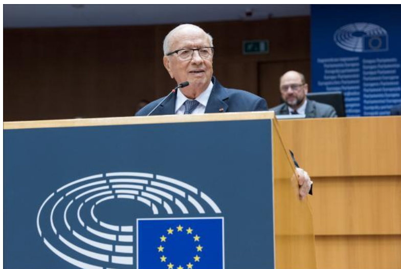
Al-BadziKa'id as-Sibsi, prezydent Tunezji

1 grudnia Al-BadziKa'id as-Sibsi, prezydent Tunezji, złożył wizytę w Parlamencie Europejskim. Prezydent Tunezji spotkał się z przewodniczącym Schulzem, z którym rozmawiał o sytuacji w Tunezji oraz o relacjach Tunezji z UE. Prezydent as-Sibsi wygłosił przemówienie na sesji plenarnej, nazywając swoją wizytę "historyczną i symboliczną chwilą".