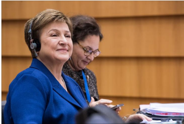
Posłowie gorąco powitali Kristalinę Georgiewę, która po raz ostatni wzięła udział w posiedzeniu Parlamentu jako komisarz

Europejskiego Trybunału Sprawiedliwości o opinię w sprawie zgodności umowy z unijnymi traktatami. Jeżeli wniosek o zasięgnięcie opinii zostanie przyjęty, Parlament będzie musiał odroczyć głosowanie nad swoimi zaleceniami dotyczącymi tej umowy.