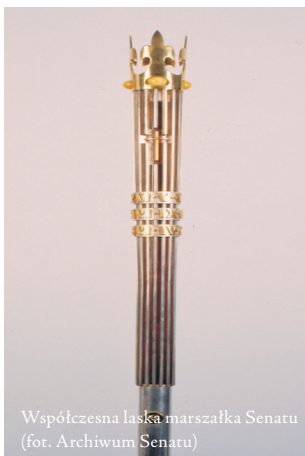
Współczesna laska marszałka Senatu

LASKA MARSZAŁKOWSKA W RĘKACH MARSZAŁKA bynajmniej nie miała wyłącznie charakteru symbolicznego, całkiem praktycznie służyła do utrzymywania porządku w czasie obrad. Stukaniem, uderzaniem, a często po prostu waleniem w podłogę marszałek starał się uspokoić zbyt burzliwie obradujących posłów. W diariuszach obrad spotyka się zapiski takie, jak ten z 4 lutego 1702 r.: „ten dzień całę nieszczęśliwy był, bo i trzy laski marszałkowskie złamały się, gdy nimi bił o ziemię, aby się uciszeli”. Taką funkcję laska zachowała w czasie Sejmów Księstwa Warszawskiego i Królestwa Polskiego. 11 czerwca 1830 r., w trakcie gwałtownego sporu, marszałek starał się uspokoić izbę „dysharmonicznym laską kołataniem”.