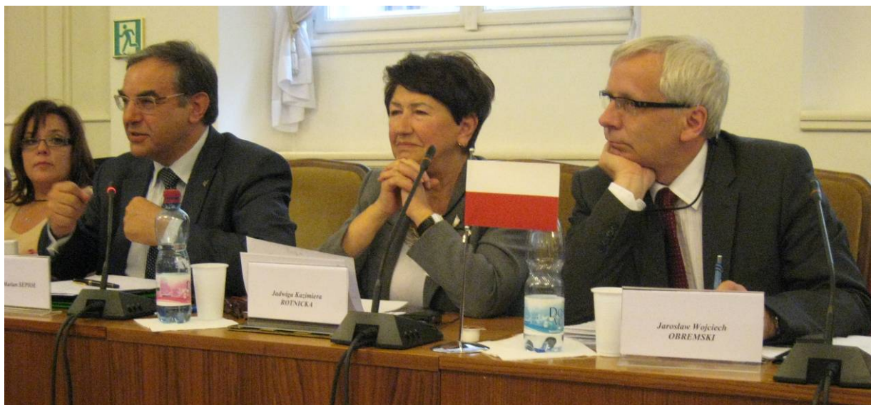
Polska delegacja w trakcie obrad.

wymi są: jak wspomóc metropolie oraz jak zapewnić współpracę różnych typów samorządów, zwłaszcza samorządów wielkich miast z gminami wokół nich.